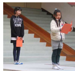
がんばることを発表する4年生