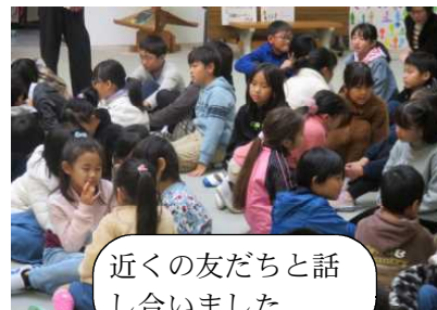
近くの友だちと話し合いました。