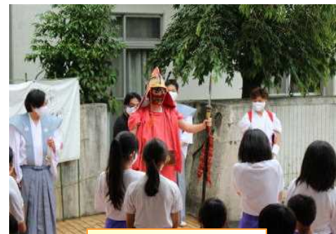
令和絆補會による慰問