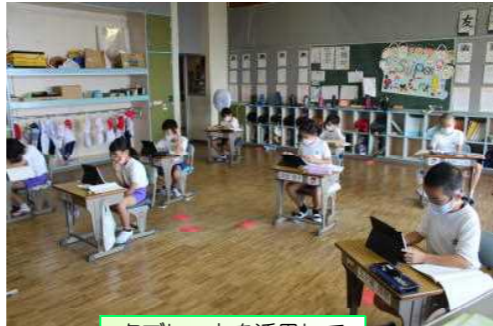
タブレットを活用して

令和3年度学校教育目標 「将来を見つめ、 夢に向かってチャレンジする子」 重点目標 「気づき、考え、行動する子」 「思いやりの気持ちを伝える子」