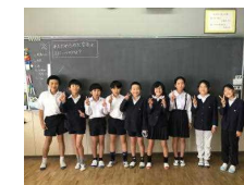
4年生 みんなでまと当て 第2位 令和2年度体力アップコンテスト