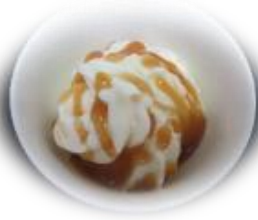
キャラメルソース Caramel sauce