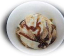
きなこ黒蜜 soybean flour and Brown sugar syrup