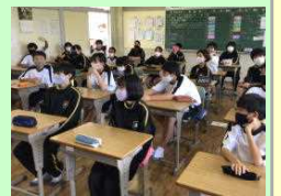
情報モラル授業の様子

昨年度より生徒一人一人にiPadが渡され、授業を中心にそれを活用した学習が行われています。先日は、ネットを活用する機会が増えていることを踏まえ、情報モラル授業を開催しました。この授業は、Zoomで市内全ての中学校をつないで行われました。なかなか市内の中学生が一堂に会することが難しい中ですが、他校の生徒と同時に繋がっている授業はとても新鮮でした。iPadが導入されることで、違った形の交流もできるようになり、ますますICT教育の役割が大きくなっていることを実感しました。iPadの負の面も踏まえながら有効活用していきます。